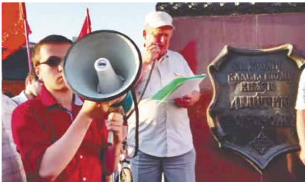
Резолюция. Принят расширенный вариант.

– Не верю, что наш митинг поможет – может быть, нам дадут что-то к сентябрю перед выборами.