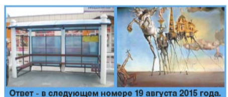
Ответ - в следующем номере 19 августа 2015 года.

Что общего между новым остановочным павильоном в городе Дзержинский и картиной Сальвадора Дали?