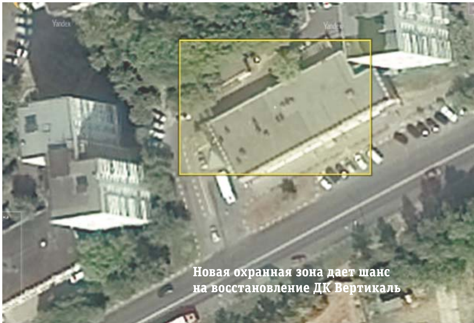
Новая охранная зона дает шанс на восстановление ДК Вертикаль