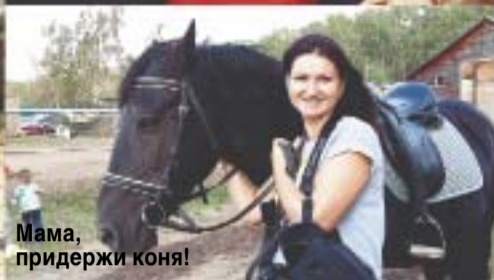
Мама, придержи коня!