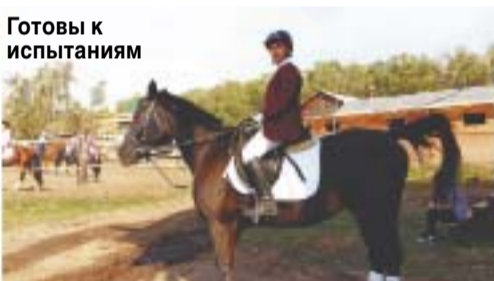
Готовы к испытаниям